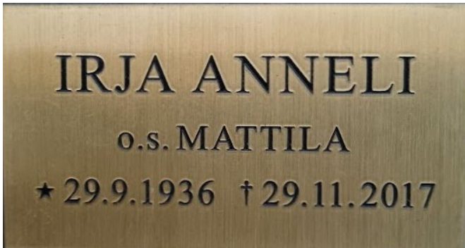
Pohja kirkas, teksti tumma, antikva

Hinnat sisältävät pronssi- ja messinkilaatoille suojalakkauksen, joka hidastaa tummumista. Soikeiden laattojen hinnat ovat samat kuin suorakaiteen muotoisilla. Kehys ei myöskään vaikuta hintaan. Koska kyse on yksilöidystä tuotteesta, laskutamme laatan etukäteen ja tilaamme, kun maksusuoritus näkyy tilillämme.