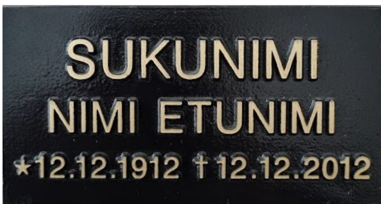
Malli 1. ilman kehystä