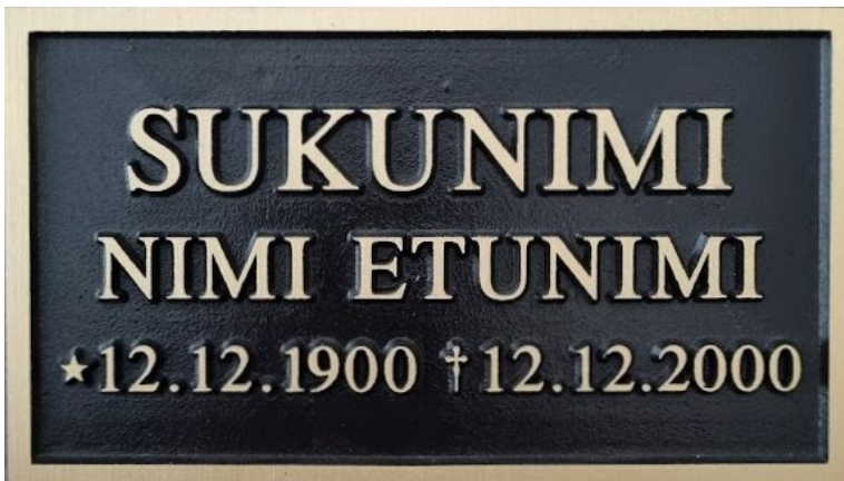
Malli 1. kehyksellä

valettu laatta kohokirjaimin, suorakaide, pohja tumma, teksti ja kehys kirkas, saatavilla eri fonteilla