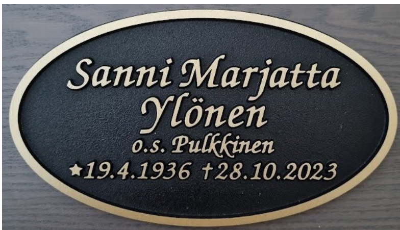
Malli 2. ovaalin muotoinen