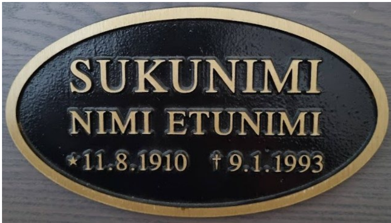
Malli 2. ovaalin muotoinen